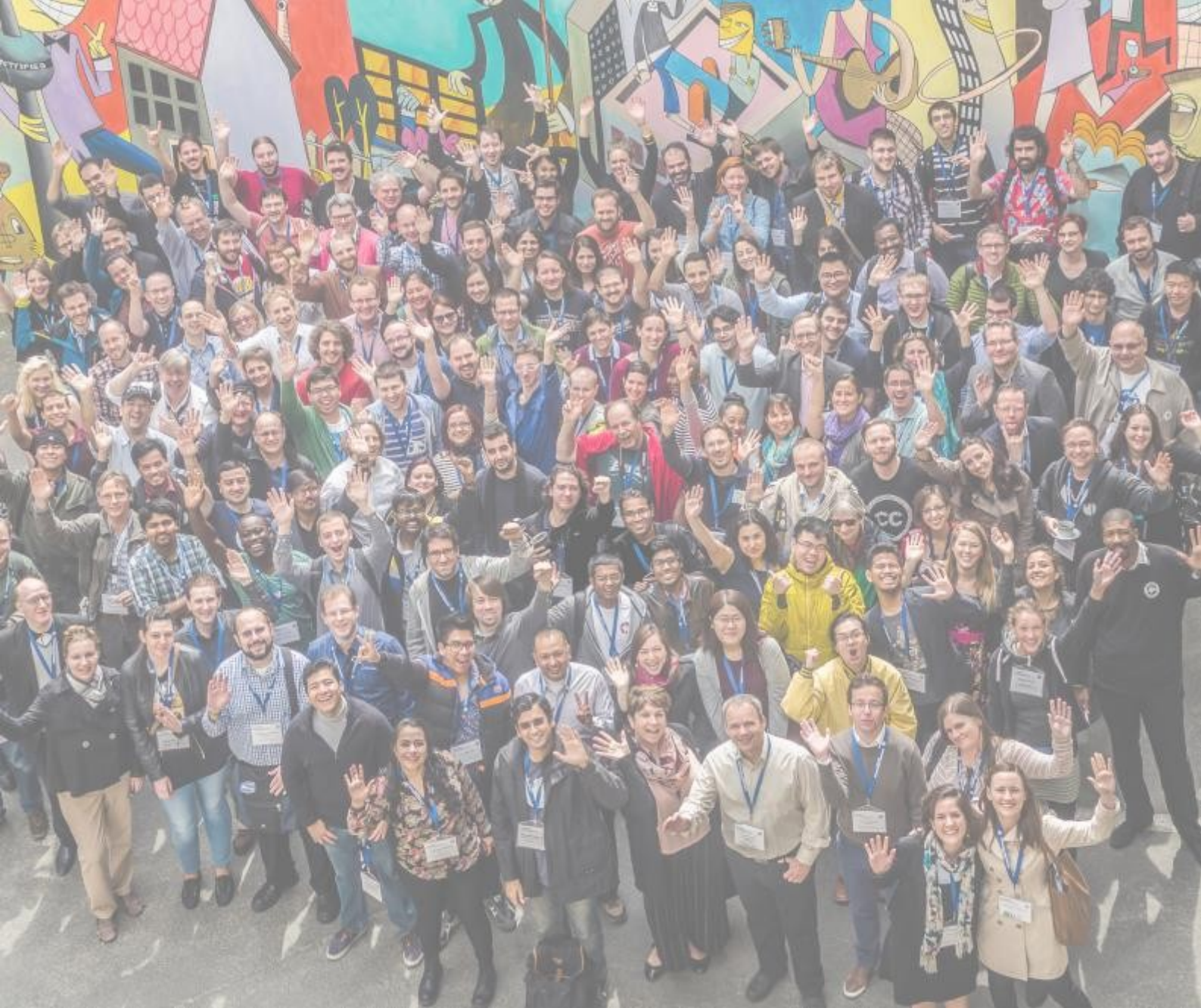
Foto: Wikimedia Conference 2015 - Group photo by Jason Krüger (own work), CC BY-SA 4.0 via Wikimedia Commons.