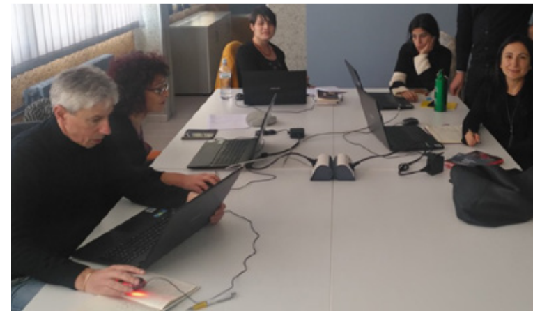
Corso formazione docenti organizzato da Wikimedia Italia (Potenza) 4, di Luigi Catalani (2019), da Wikimedia Commons, CC BY-SA 4.0.

Tutte le informazioni e gli aggiornamenti sono disponibili sul sito di Wikimedia Italia qui: https://www.wikimedia.it/formazione-docenti/